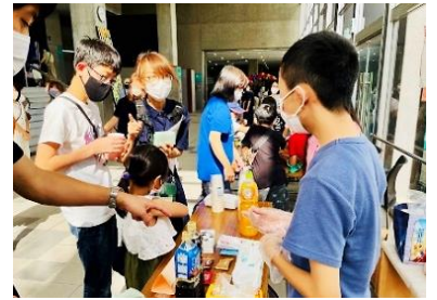
「コーヒーとジュースください〜♪」