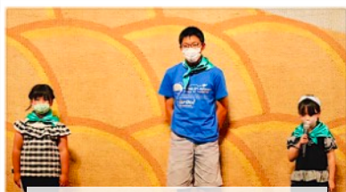
「挨拶係」はスワンサークル