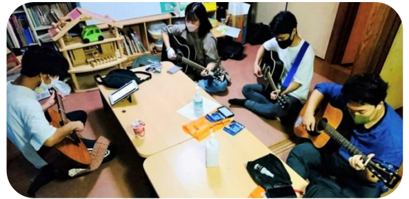
〈ファイヤーのためのギターの練習も欠かせない〉