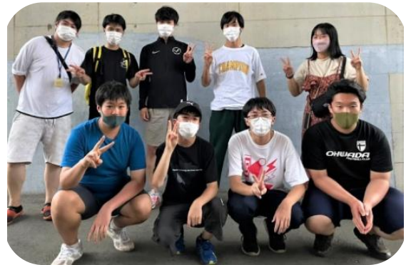
〈実行委員と班長たち〉