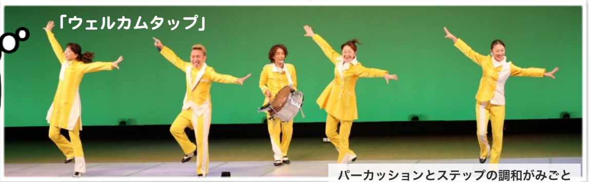
「ウェルカムタップ」