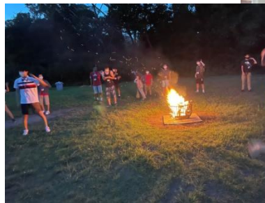
〈ファイヤーを囲んで〉