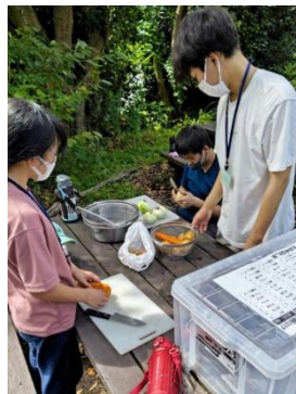
〈カレーの野菜切りに挑戦〉