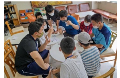
〈ちょっとした間もトランプ〉