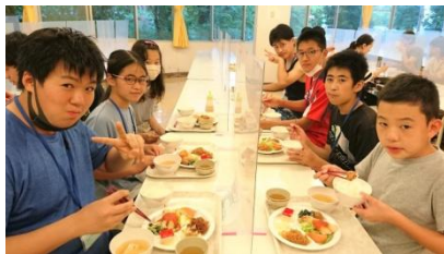
〈食堂では班ごとに食事〉