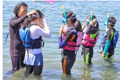
〈装備を整えて、いざ海へ！〉