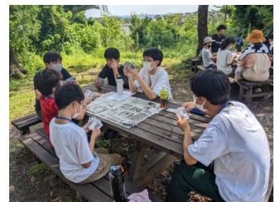
〈トランプで「大富豪」大会〉

海でのキャンプ！スノーケリング体験では、プロの指導のもと、沖の方まで行くことができ、きれいな海で、きれいな魚を見る体験ができました。久しぶりに実施した夜のキャンプファイヤーは、点火するまでの企画を実行委員が考えて準備しました。火の周りで思いきり踊って、きれいな星空をみんなで見る事ができました。野外炊事では、野菜切りや火おこしにそれぞれがチャレンジして、おいしいご飯とカレーができました。