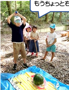
夏はやっぱりスイカ割り!