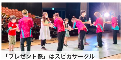
「プレゼント係」はスピカサークル 八千代の名産 おいしい梨です