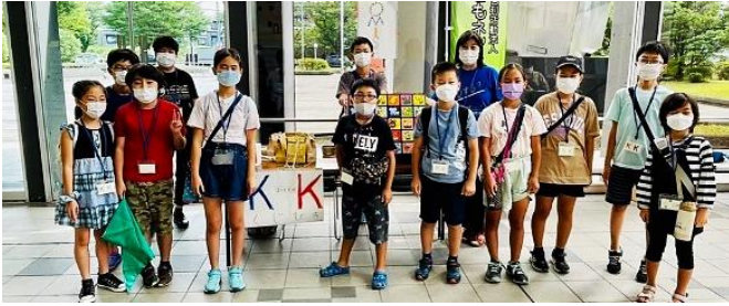
くじ引きの「OMISE」をしました

小学生チーム(KK)と中学生サークルは、9月のTAP DO!の「スペシャル・パーティタイム♪」公演の時に、ホワイエ(ロビー)に集まり、会場を盛り上げました!