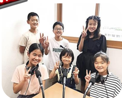
タップダンスは足が こんがらがりそうになりました！

タップダンスのワークショップに参加した子どもネット八千代の子ども達が、ラジオ出演しました。ワークショップの感想や、行ってきたばかりの夏のキャンプ、過去の「子どもの創造表現フェスティバル」など、印象に残った活動の思い出を語ってくれました。