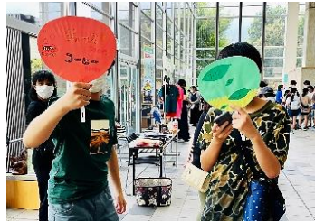
うちわにメニューを書いて営業中