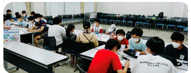
〈班長を中心に班ごとに交流タイム〉

キャンプの当日を、より安心して楽しめるように、参加者交流会を開催しました。高校生以上の実行委員メンバーが企画・進行をしました。名札の裏に書いてある文字で仲間を探す班分けゲームの後、4つの班に分かれて、しおりの確認、係決め、キャンプのときに呼びあうキャンプネームを決めました。そして、キャンプファイヤーの時に踊るダンスをみんなで練習。右～左～など、実行委員の丁寧な声かけに合わせて、みんな上手に踊っていました。(子ども部 山下)