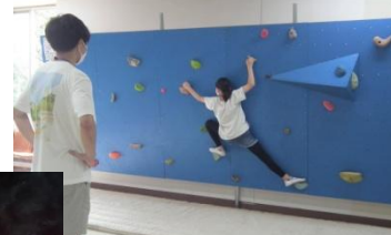
〈ボルダリングにも挑戦〉