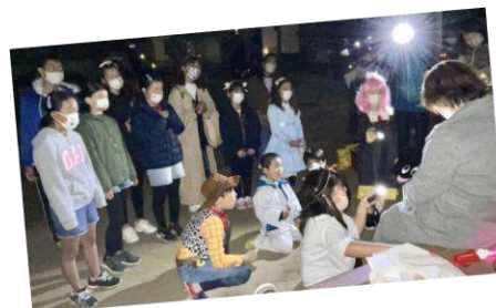
夜の街は雰囲気が出ます