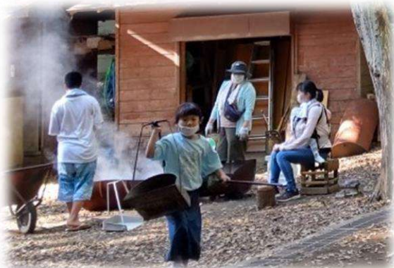
森の中でのゆったりした時間♪

秋の澄んだ空と心地よい風が吹くガキ大将の森で、たき火を囲んで食材を焼いて食べて、遊ぶ。ただそれだけの事が毎回とても贅沢に感じます。マッチを怖がっていた子ども達も、今では恐れずにシュッと火をつけられることを誇りに感じている様子。さて、次回は何を焼いて食べようかな…！ (プーさんサークル 内藤)