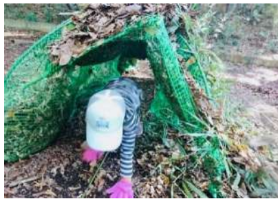
落ち葉のトンネル♪