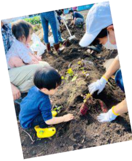
みんなでトトロポーズ