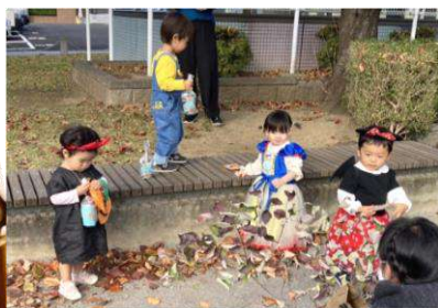
どの子も本当に可愛い