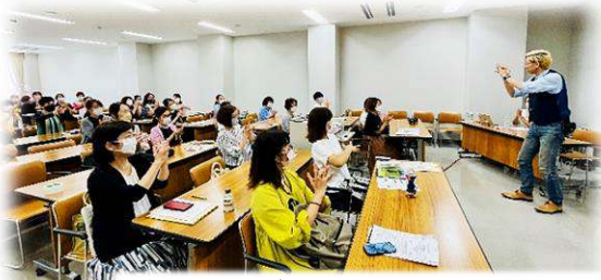
参加型のマジックも披露してくださり、軽快なトークに参加者は笑いつばなし！

自宅の一室が子ども劇場の事務局で、小さい頃からたくさんの舞台を観て育ってきたという古田さん