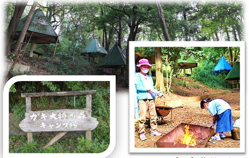
マッチ ぜんぜん怖くないよ