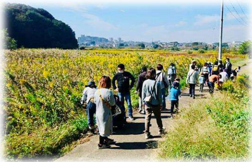
みんなで秋探しのお散歩