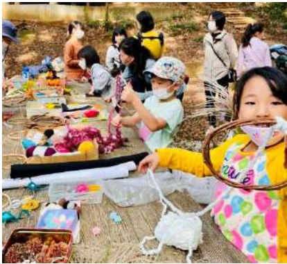
ハロウィンの飾りにするの