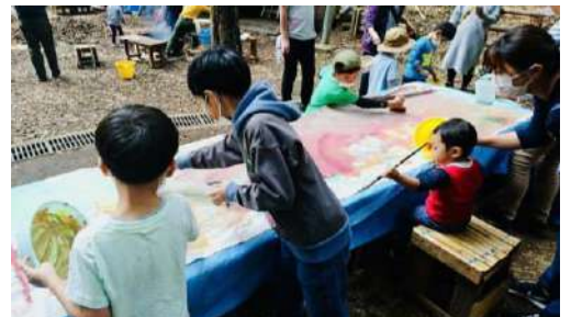
オリジナルの森の旗を作ったよ

抜けるような青空の下、「ガキ大将の森であそぼう～秋の森あそび～」が開催されました。まずは、心地よい秋の風を感じながら、秋探しのお散歩からスタート！ススキや木の実、草の実、虫などを見つけて、早速ゲット。それから、散歩で見つけたものと小枝や草のツル、毛糸、フェルトなどを組み合わせて、ハロウィンの飾りづくり。切ったり貼ったり、巻いたり結んだりして、オリジナリティあふれる力作ができました。また、落ち葉でトンネルを作ったり、大きな布をアクリル絵具で塗りあげて、森の旗を作ったりもしました。