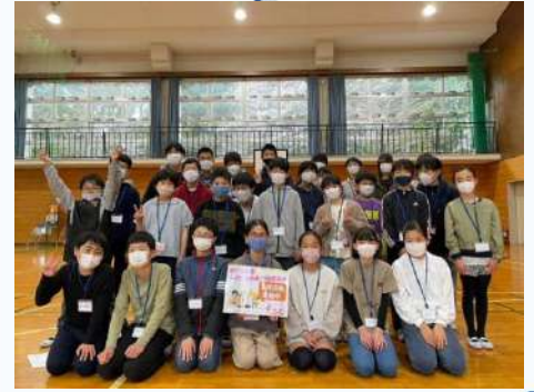
雨なので体育館でいっぱい遊びました♪