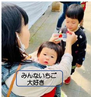
みんないちご大好き