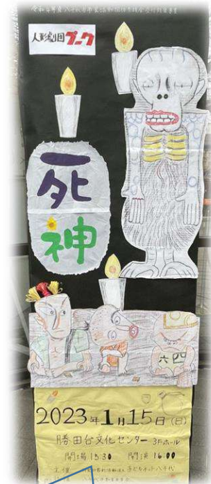
看板はオレンジサークルの力作