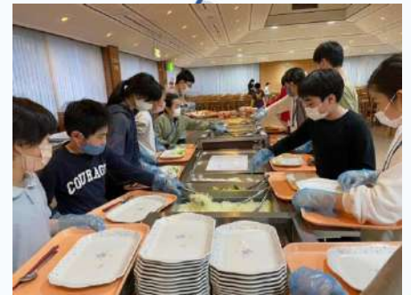
食事は楽しみバイキング♪