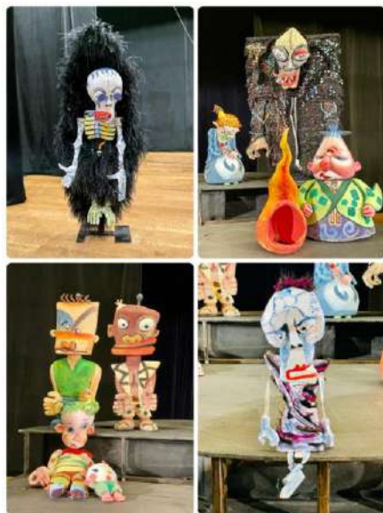
個性的で表情豊かな人形たち