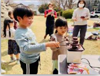
わぁ チョコレートファウンテン!

3月12日(日) 11:30～ 勝田台第6公園 参加者:子ども12名 大人10名 計22名