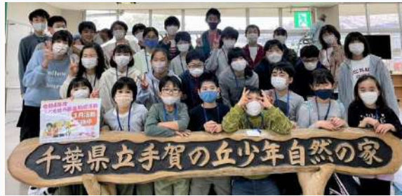
来年も、また一緒に来ようね!