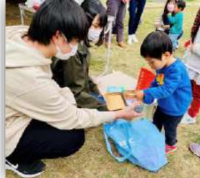
くじ引き...ワクワク