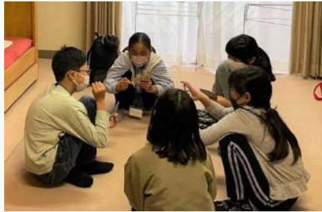
お部屋で、まったりタイム