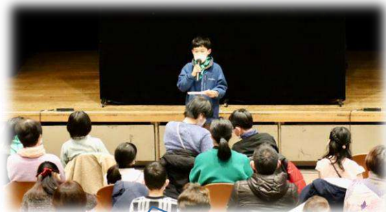
始まりはメリーサークルの堂々とした挨拶