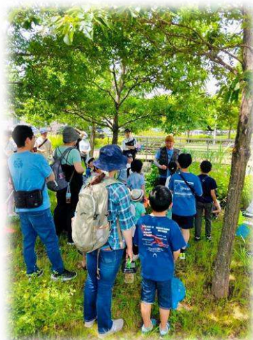
探検前にゾウムシやカメムシ、 蟻などこれから会えそうな生き 物についてのお話をききました