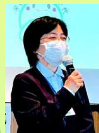
長い間ありがとうございました

創造団体の方を講師に呼ぶワークショップでは、決まったことを決められたとおりにやる、という思考停止の日常に慣れていて私にとって、「好きなように考えなさい」「自分で表現してみよう」ということが一番苦手でした。しかし、子ども達と一緒に取り組めば、彼らの柔らかな発想に私自身の「子ども心」を少しだけ取り戻せたように思います。