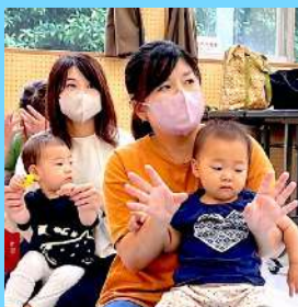
おひざの上で 手遊びをしながら シアターを楽しみました