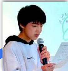
スタッフとして関わった事業についての報告