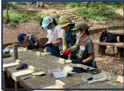
作業台の上で竹のお箸を作ります