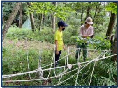
木と木の間にロープを張って基地づくり

野菜を切って、かまどの火で野菜汁を作ったり、マシュマロを焼いて食べたり、外で皆と一緒に食べると、とっても美味しい！マッチやファイヤースターターで火をつける体験もしました。