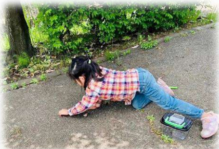
自然の世界に入り集中する姿が ほほえましいです