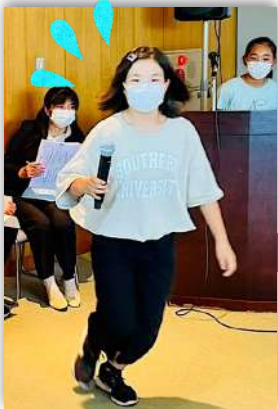
質問者のもとへマイクを持って走ります！