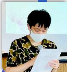
出席できない子の報告を代読しました