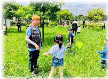
隊長、こんな生き物を見つけたよ