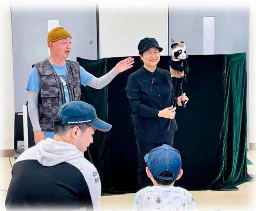
ささき隊長とゴンベのやりとりが楽しい！

人形遣いのおいけ家金 魚さんが操るゴンベ。 タヌキの特徴を忠実に 再現しています