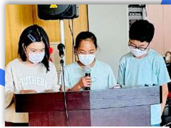
KKメンバー3人による司会練習もバッチリです