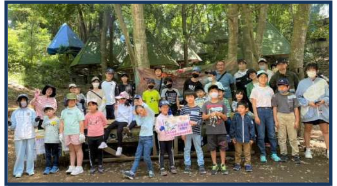
お天気になったのは、みんなの行いが良かったから？

自然の中には、あそびのヒントがたくさん隠れています。ちょっとした声かけで、子ども達は、それを見つけ出し、工夫しながらあそびを広げていきます。そんな子ども達を見守りながら、私たち大人も、自然の中で、ゆったりした時間を過ごしました。ご協力いただいた「ガキ大将の森の会」、「タケタテカケタ」の皆さん、ありがとうございました。(子ども部 高田)