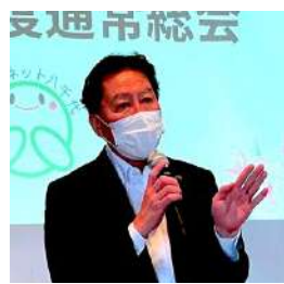
コロナ禍での活動について市長から労いの言葉も