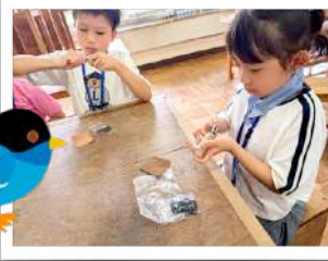
バードコール（鳥笛）づくり 吹いたら鳥が寄ってくるかな