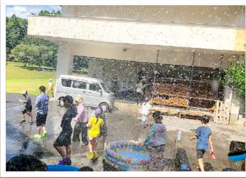
夏はやっぱり水あそび ずぶ濡れになってもOK！ ふだんできないことを思いっきり