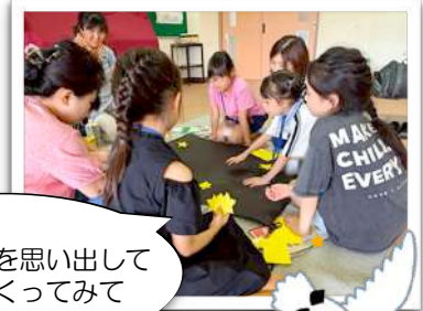
昨夜見たのを思い出して 星空をつくってみて