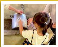
なべにススが付かないように コーティング