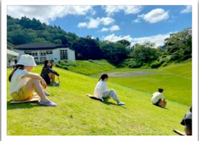
広いからすべり心地も最高です