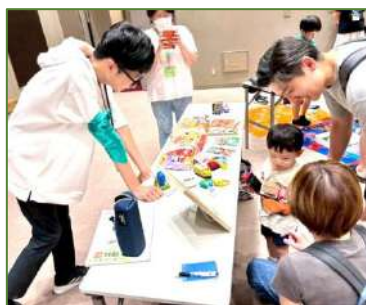
どれにしようかな・・・