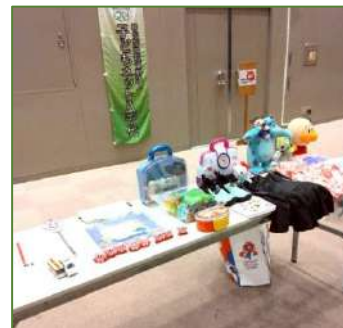
お店に、持ってきた物を並べます。

最初は、恥ずかしくてモジモジしたり、「これとこれを交換してください」と言い出せなかった子ども達も、慣れてくると、交換してゲットしたものを「わらしべ長者」のように、さらに別のものと交換したりして、コミュニケーションを取りながら、交換そのものをゲーム感覚で楽しんでいる様子が見られました。