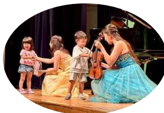
↑プレゼント係さんは「プリンセスにプレゼント渡したよ」と大喜び♪