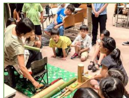
堅い竹の扱い方を教えてもらいます

この竹ボールは、紐を通してぶら下げる飾りにしたり、試験管を入れて一輪挿しにしたり、小さなLEDライトを入れて灯りにしたり・・・色々な楽しみ方ができるそうです。