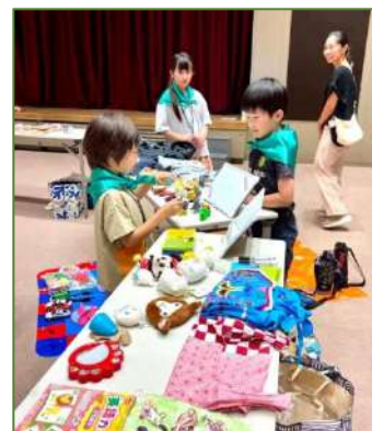
早速交渉開始です!